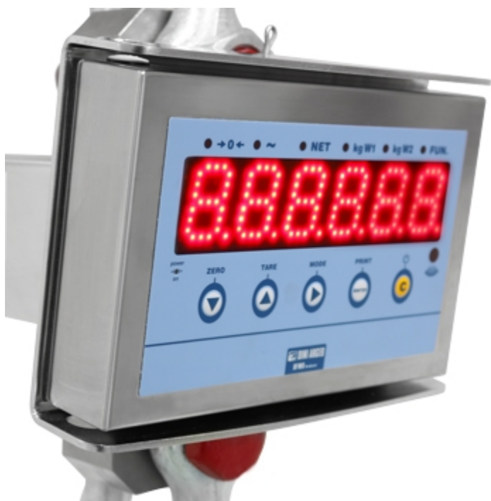
Dinamometro MCW09: display super-luminoso da 40mm