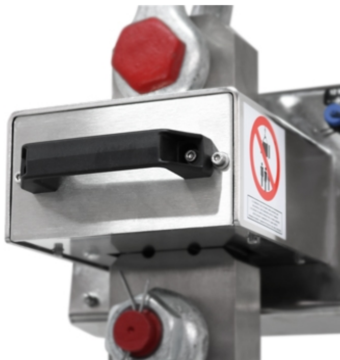
Dinamometro MCW09: dettaglio della batteria estraibile